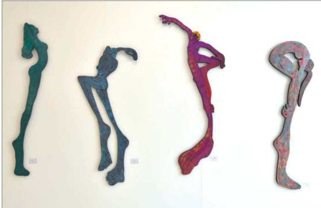
I am satisfied; Die Resignation; Rhythmus