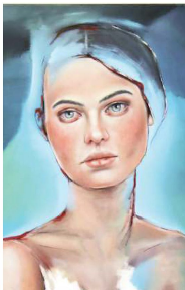
Layers of being