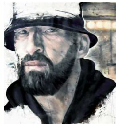
Layers of Music