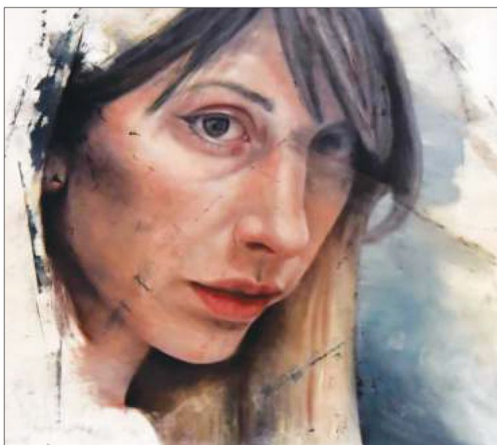
Layers of happiness