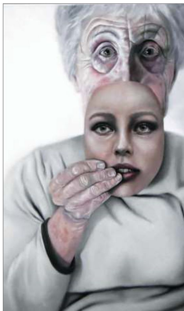
Ich sehe mich