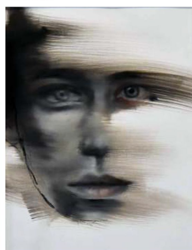
Short Cut B