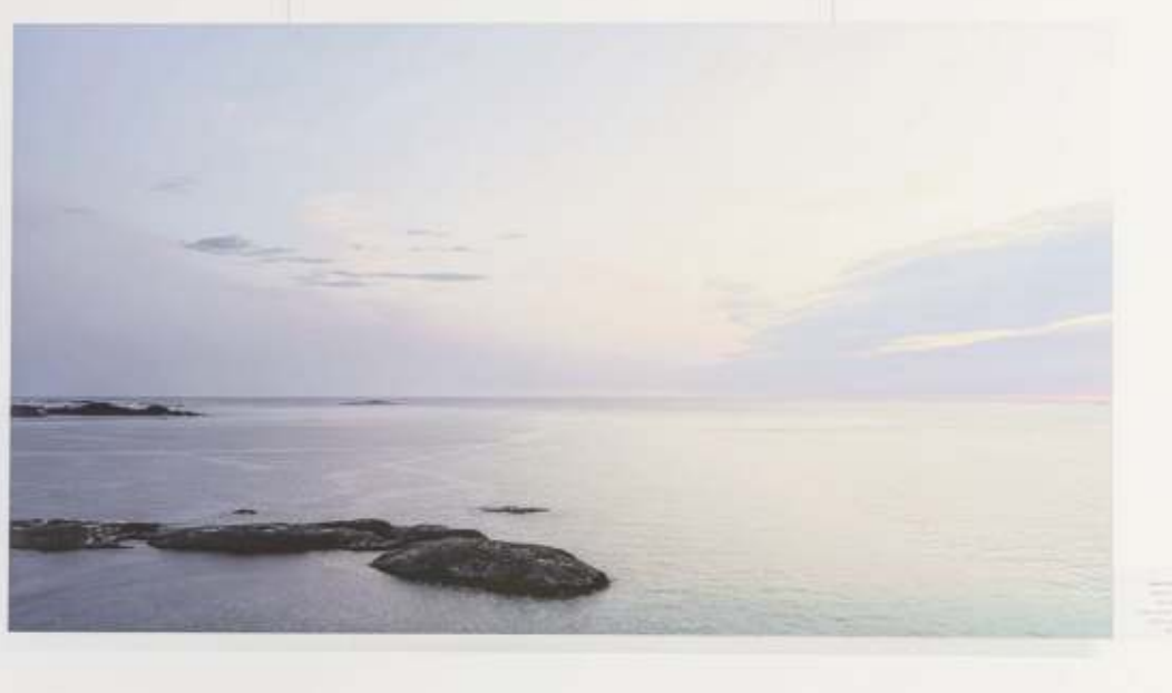
Soleil de minuit

Vom 2. März bis zum 13. April in der Galerie Schortgen