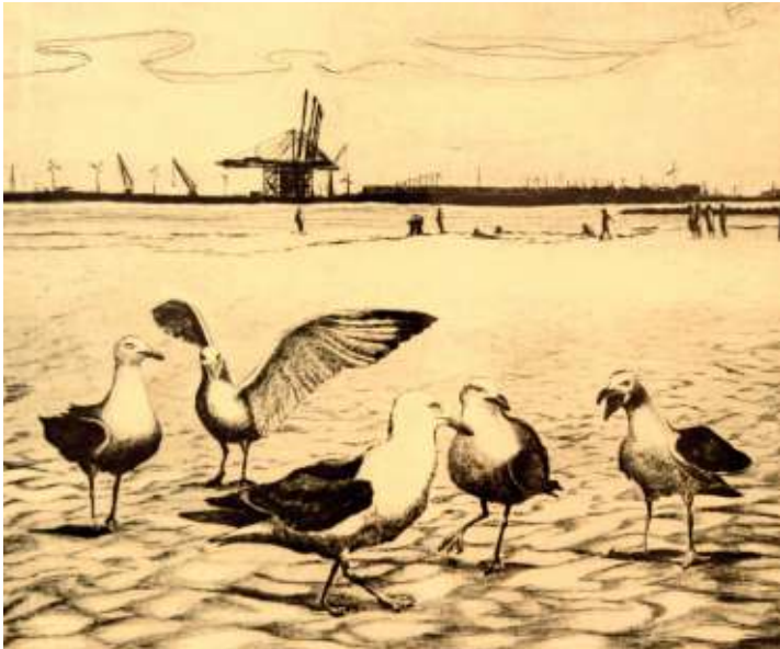
Les pieds dans le sable, pointe sèche de Marie-Pierre Speltz

Les bénévoles de La Palette, animés par un enthousiasme et une passion inébranlable présentent au public des expositions de haute qualité. L'actuel Festival de la Gravure per-