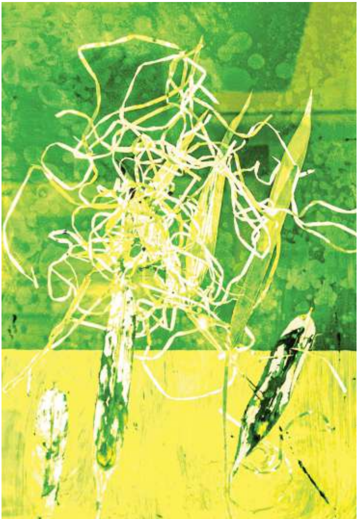
Botanical, aquatinte et calligraphie de Soheila Knaff