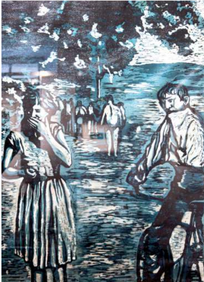
Momenti di Felicia, gravure sur planche perdue de Valentina Biletta