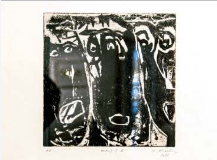
Really, transfert et pointe sèche de Serge Koch