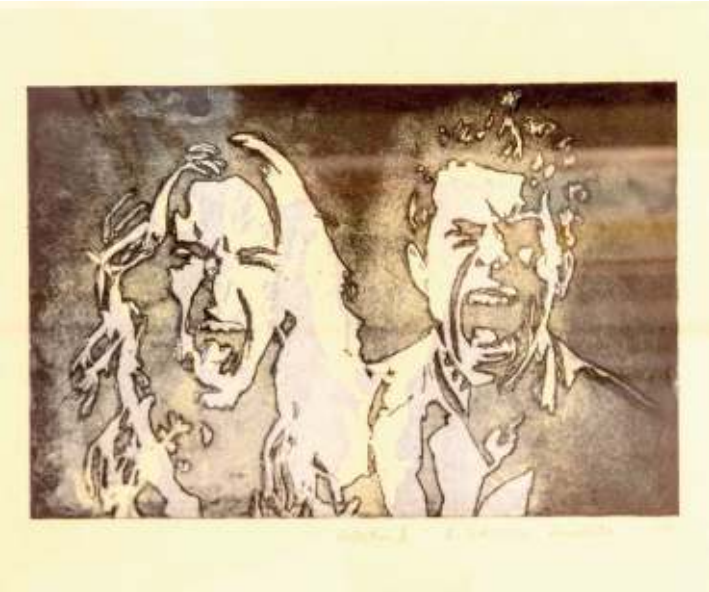
Entsetzen, aquatinte d'Ernest Rayeck

Il faut impérativement remercier le Comité de l'Association Artistique La Palette Diekirch pour avoir mis sur pied l'Edition 2025 du Festival de la Gravure, une édition qui rassemble 54 artistes de haut niveau, venus des quatre coins du globe. Cette année, un invité, la Villa Vauban qui présente une sélection de gravures du XVème au XXème siècle revisitée par le regard contemporain de l'artiste Julie Wagener.