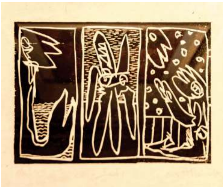
Sad, xylographie d'Ann Vinck