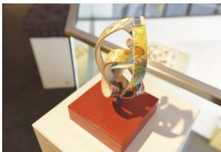
Fleur de Lys, sculpture de livre