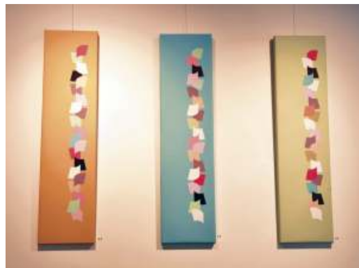
Farandole ocre, Kyrielle bleue, Ribambelle verte