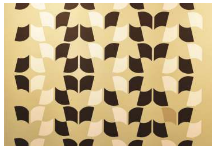
Flores et Butinages