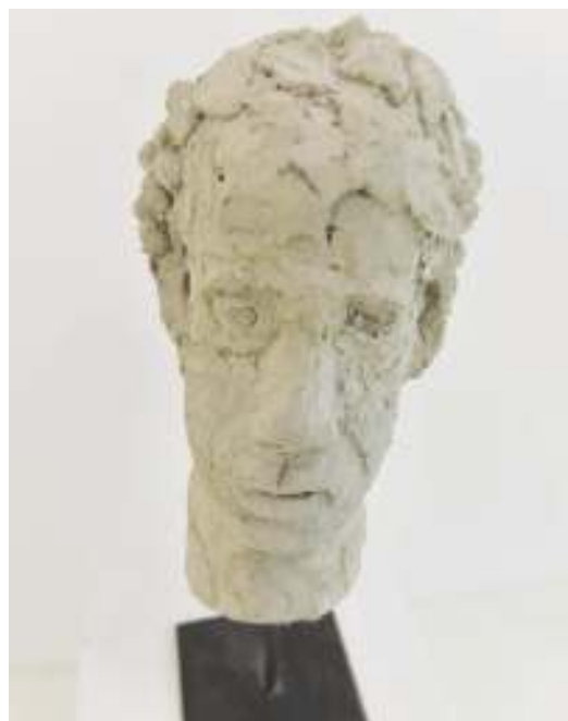
Figure 5, sculpture