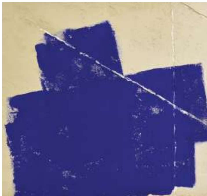
Blue ship 1