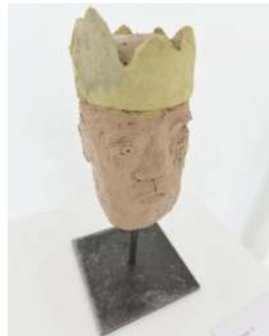
Figure 10, sculpture