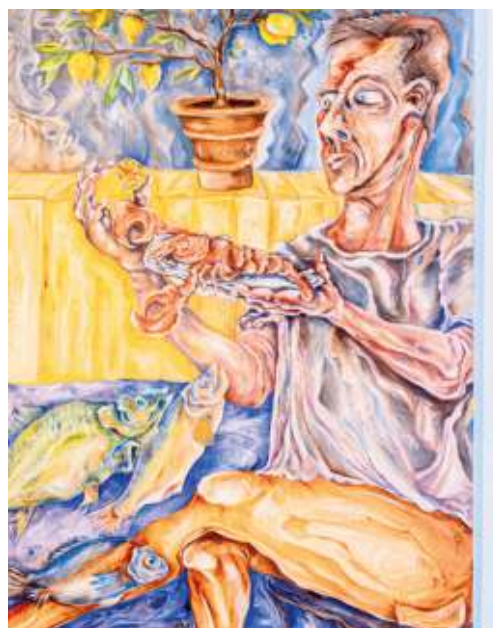
Fische und Zitronen, de Jacques Schmitz