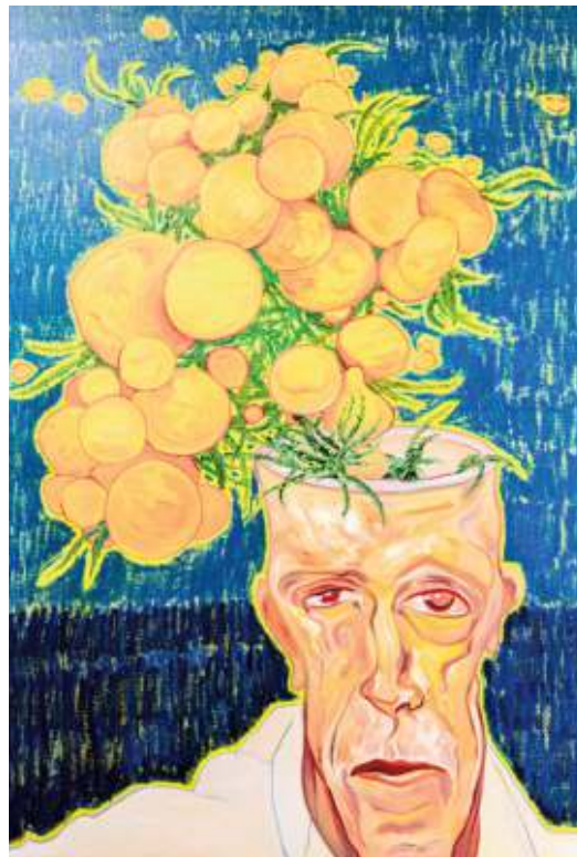
Mimosa Head, de Raphael Tanios

J'utilise la peinture à l'huile pour réaliser mes œuvres. La