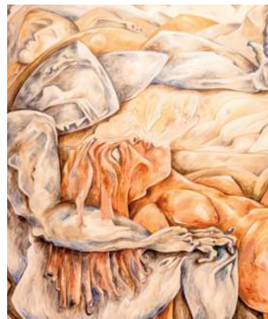
Helfersyndrom, de Jacques Schmitz