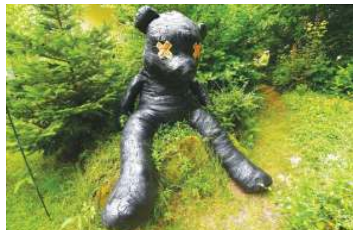
Sculpture de Chiara Dahlem