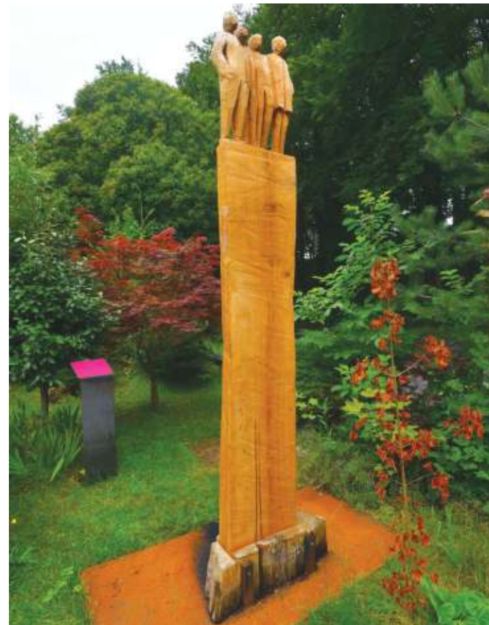
Au-dessus de la mêlée, sculpture de Laurent Turping