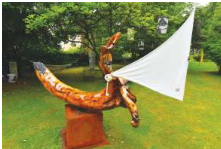
Le radeau de la Méduse, Raphaël Springer