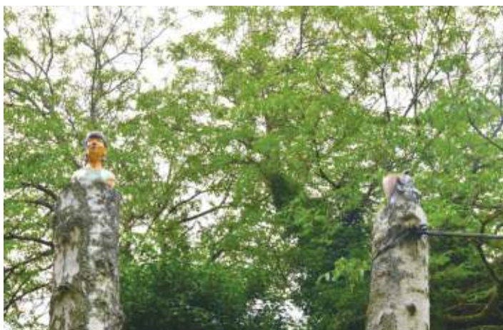
Bustes de Menny Olinger