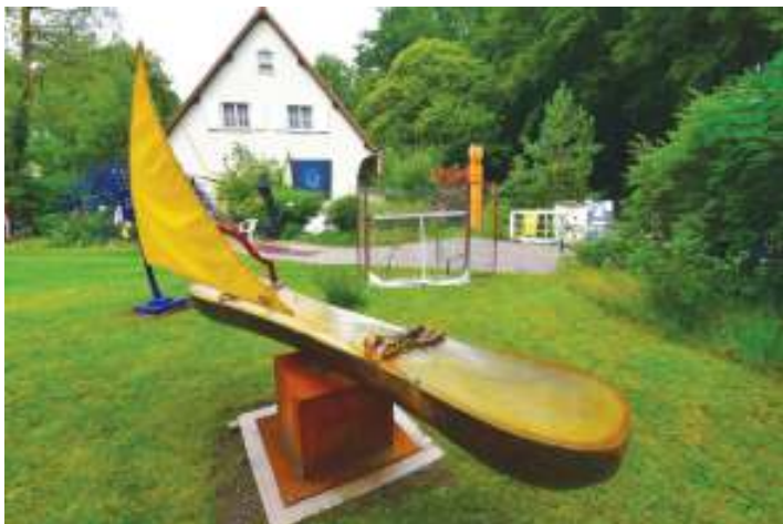
Le bateau ivre, Raphaël Springer