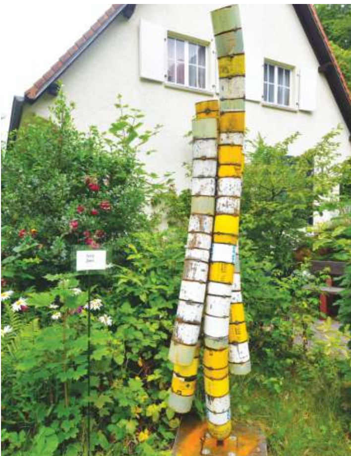
Des sculptures en métal qui saluent le ciel, de Assy Jans