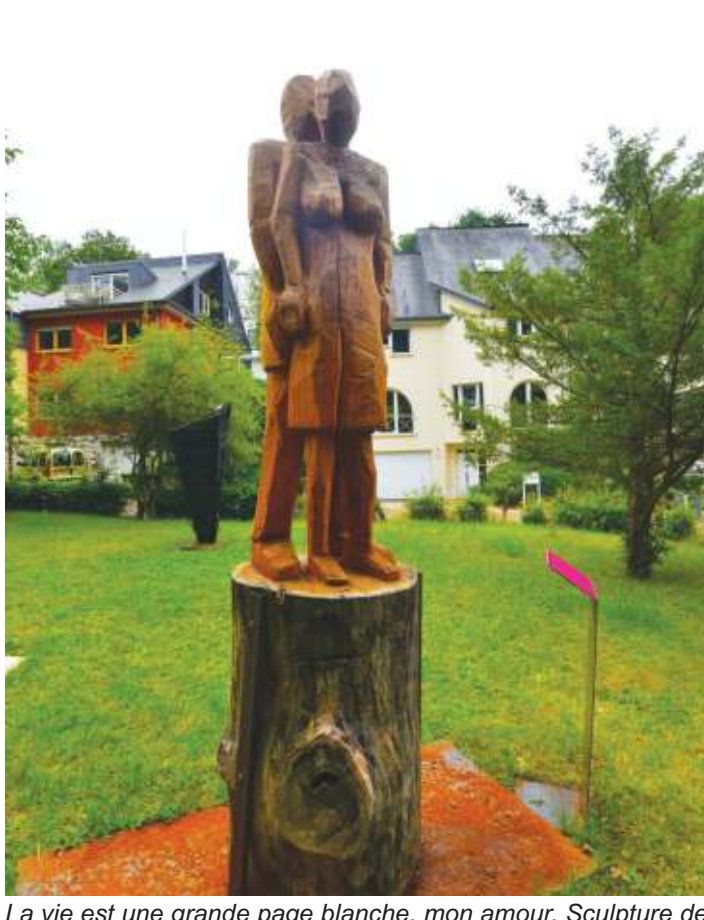
La vie est une grande page blanche, mon amour. Sculpture de Laurent Turping