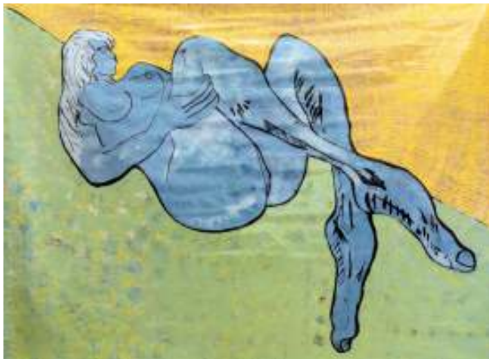
Die Ruhende, de Josiane Ginter

Son symbolisme particulier de la femme aux grands pieds et aux grandes mains, ainsi qu'aux jambes longues, reflète la force, la stabilité ainsi qu'un lien avec la terre ou encore un profond sentiment d'enracinement. Les longues jambes représentent la maniabilité et la capacité à s'épanouir, les grandes mains la