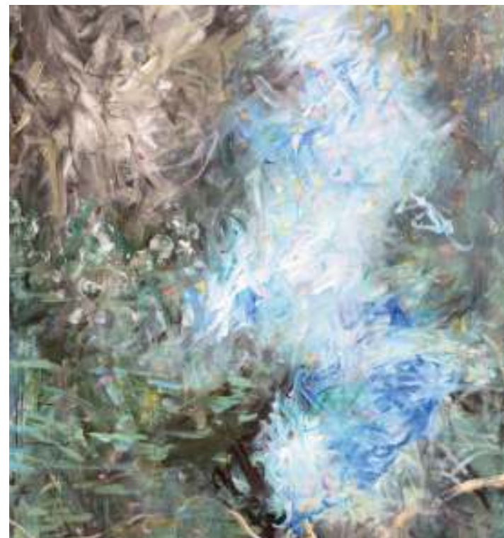
Mouvement dans le silence, de Rose Antony